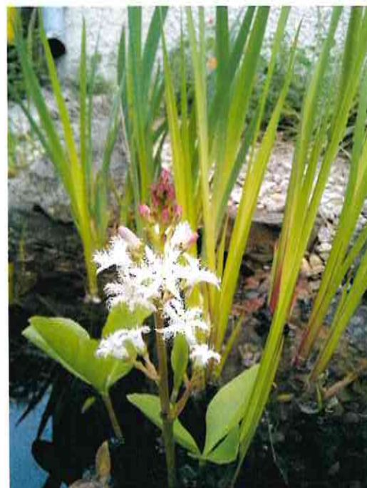
vzácná vachta trojlistá