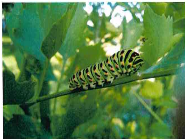
housenka otakárka fenyklového